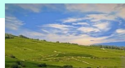
Dans le vignoble